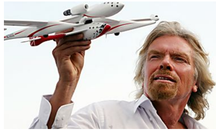
Branson's Latest Investment Just Leaked and Is Now Viral Growber