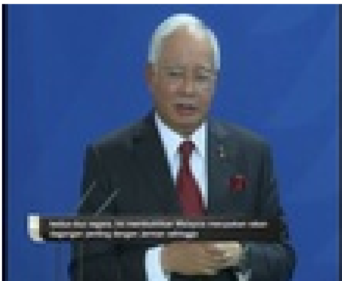
Malaysia, Jerman perkukuh hubungan dua hala