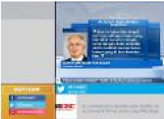
Penurunan ringgit tidak seburuk yang didakwa