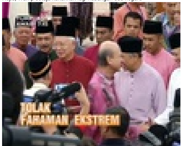
AWANI 7:45 malam ini: Ancam keselamatan Negara, tolak fahaman ekstrem & lelaki makin pupus?