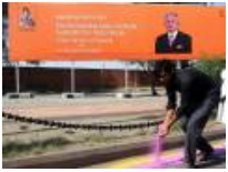
Najib ke Jaipur teroka peluang pelaburan bagi syarikat Malaysia