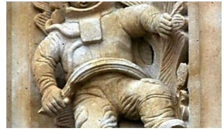
Is This Proof Of Real Time Travel? Mozo Travel