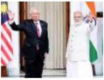
PM Najib dan Modi setuju kerjasama rapat tangani keganasan