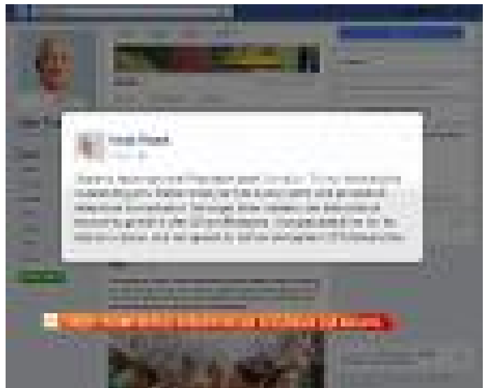
Najib, Trump setuju kukuhkan lagi hubungan dua negara