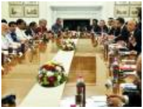
Malaysia dan India meterai enam MOU, satu perjanjian tingkat hubungan dua hala