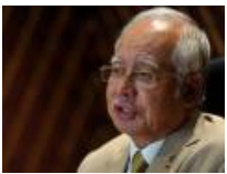
Malaysia, India adalah pemimpin orde baharu yang sedang muncul di Asia - PM Najib