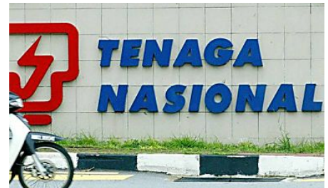
TNB tingkat ranking dalam 50 jenama utiliti terbaik global