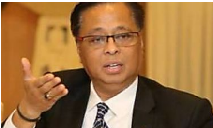
Ismail Sabri cadang buka Low Yat 2 di Bangunan MARA