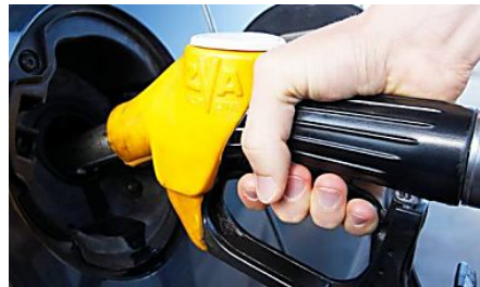
Harga siling petrol diesel ditetap secara mingguan - Hamzah Zainudin