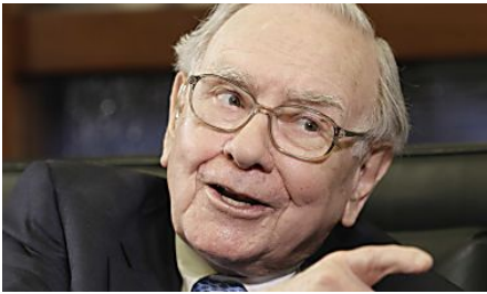
The Richest Man In The Worlds Investment Just Went Viral Tip Toe Jordan